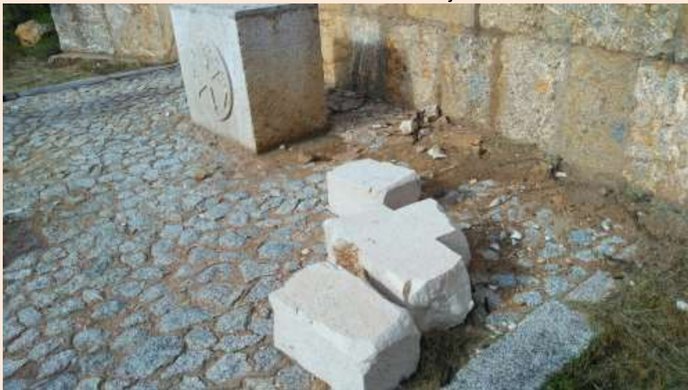
Restos de la cruz profanada del monumento