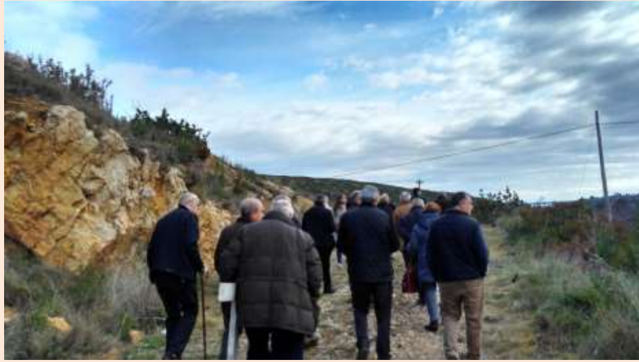
Rezando el Viacrucis camino del lugar del martirio