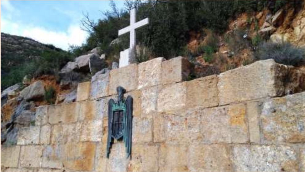
Aspecto del monumento, múltiples veces profanado y restaurado