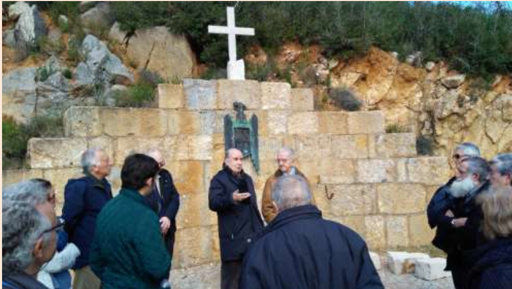
Parlamentos de homenaje