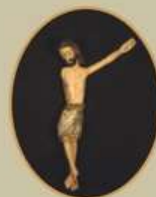
JORNADAS MARTIRIALES DE BARBASTRO