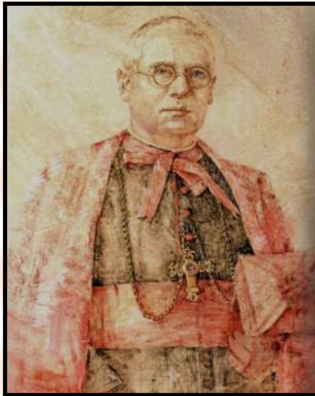
Cuadro de Mons. Irurita de D a Ester Cañadas en la sede de la Conferencia Episcopal Española

donde, cumpliendo su voluntad, descansan sus venerados restos, y en memoria de los 930 sacerdotes, religiosos y religiosas y de los fieles de esta diócesis, mártires durante el trienio 1936-1939