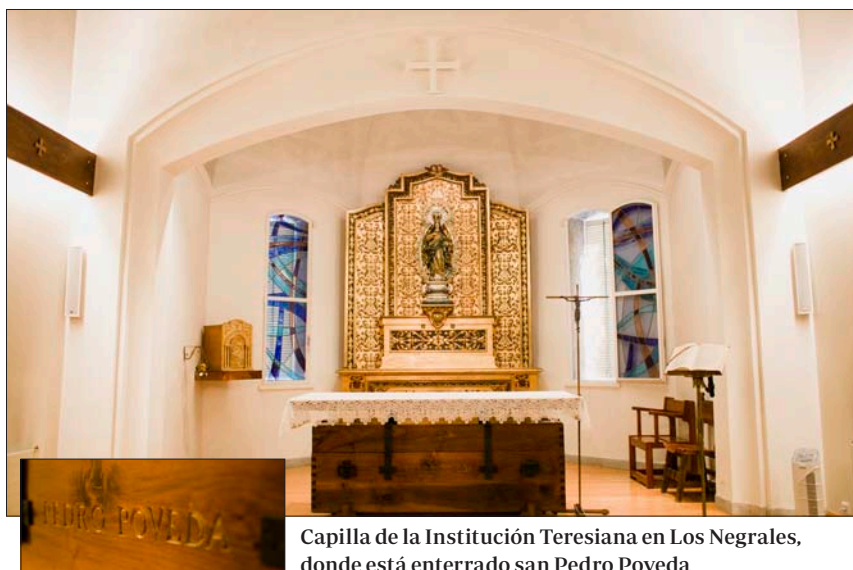
Capilla de la Institución Teresiana en Los Negrales, donde está enterrado san Pedro Poveda