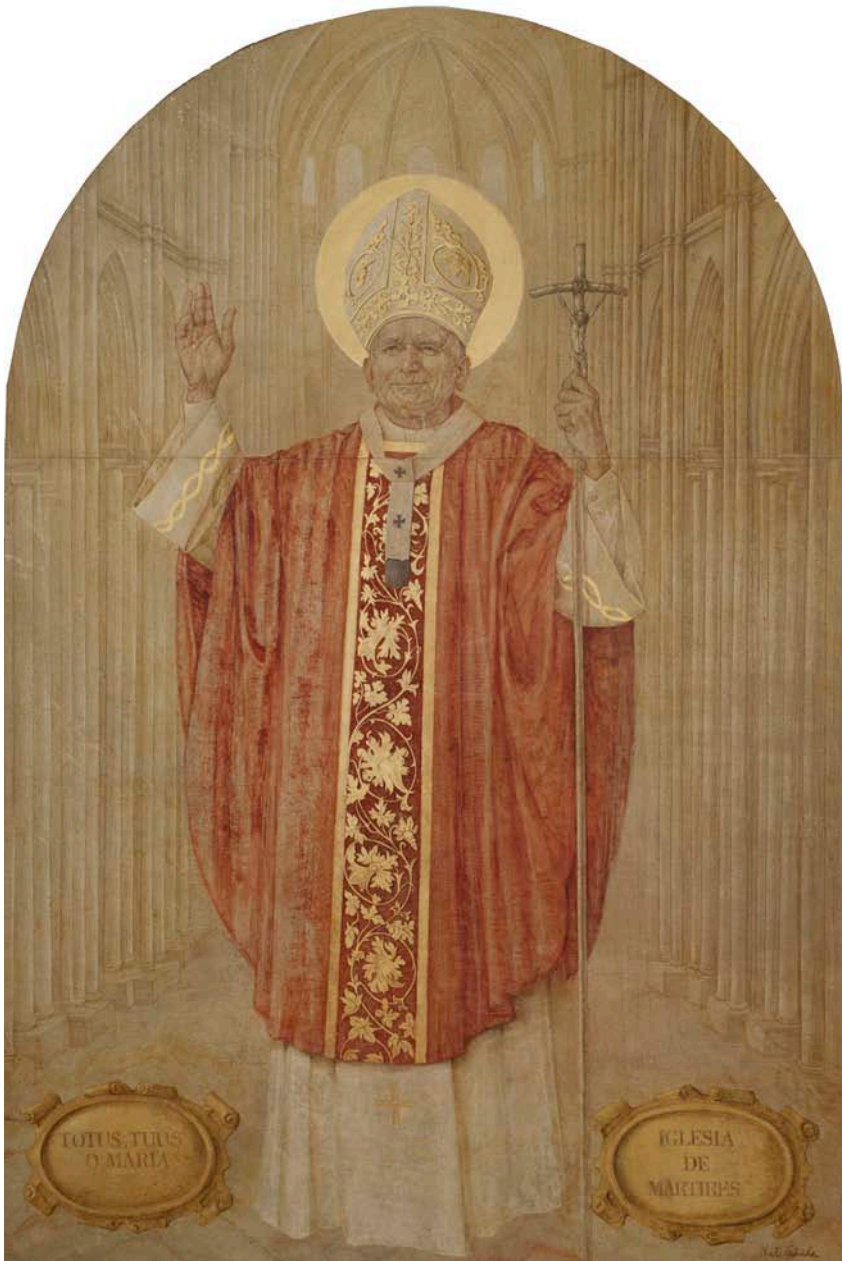
Icono de san Juan Pablo II

El mismo lugar elegido para albergar los iconos, la iglesia de las Calatravas, posee una poderosa resonancia martirial, pues en sus sótanos, durante la Guerra Civil, se celebraba clandestinamente la Eucaristía, y desde allí se llevaba la comunión en secreto para fortalecer y preparar para el martirio a muchos fieles escondidos en el centro de la capital.