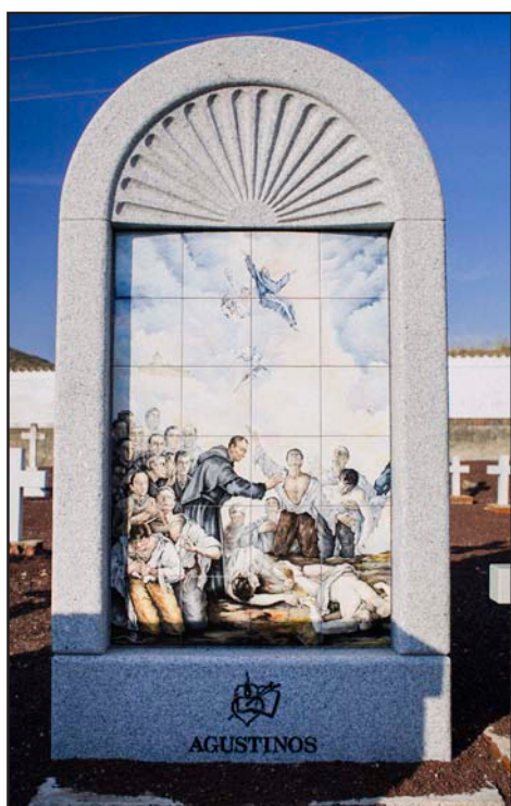
Mosaico en el cementerio de Paracuellos