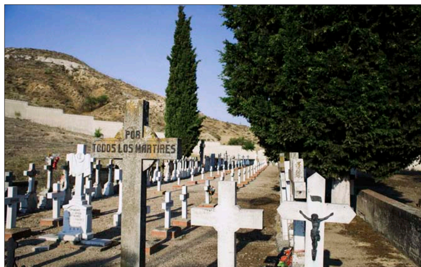
134 mártires están enterrados en el cementerio de Paracuellos del Jarama