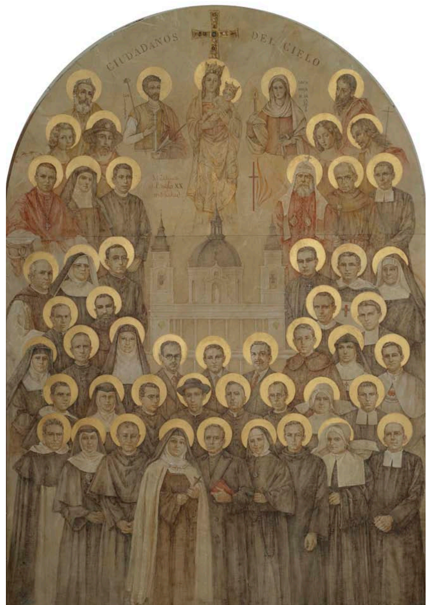
Icono de los santos mártires del siglo XX en Madrid