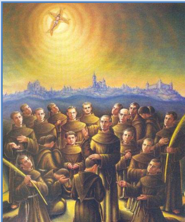
Mártires Franciscanos de Castilla