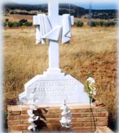
Cruz de mármol que recuerda el lugar del martirio.

A el Beato Domingo Alonso de Frutos le dijeron se bajase del camión pues no estaba en la lista, pero él contestó: “Domingo no se baja; Domingo irá donde vayan sus hermanos” .