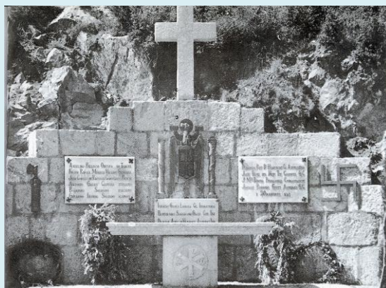
Aquí los inmolaron 7-feb-39. Can Tretze