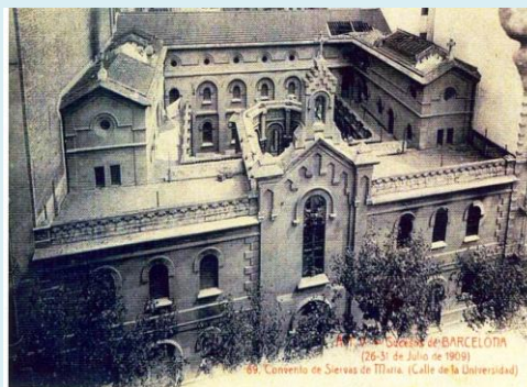
Prisionero. 23-ene-38 → 23-ene-39