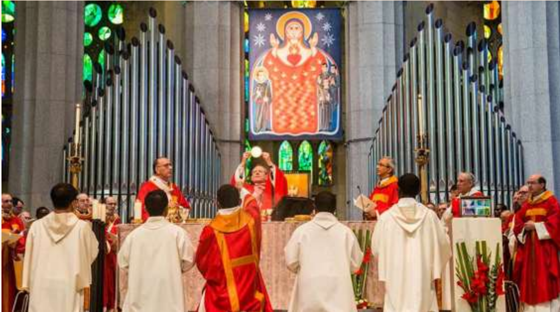
El Cardenal Amato en la elevación de la Hostia durante la consagración en la Santa Misa

muerte y destrucción, dejando tras de sí miles y miles de víctimas indefensas e inocentes, ante la cual “Nos conforta que todos los religiosos se comportaron con fortaleza y dignidad e incluso con alegría, sin nunca traicionar su fidelidad a Cristo y a la Iglesia, ya que si antes de ser asesinados los milicianos les prometían la libertad si abjuraban de su fe, ninguno lo hizo, y los 109 mártires claretianos, respondieron con la eficaz arma del perdón a aquel intento de aniquilar el cristianismo en España.”